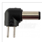
ø5,5 - 2,5mm