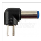
ø5,5 - 2,1mm