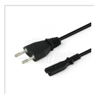
Cavo d'ingresso con spina Europa